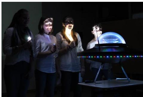
Projektpräsentation der 9. Klassen