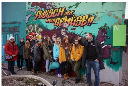
Impressionen aus dem europäischen Graffiti-Projekt

Seit 2008: enge Zusammenarbeit mit Schulen aus vielen Teilen Europas