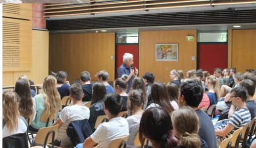
Einladung externer Referenten