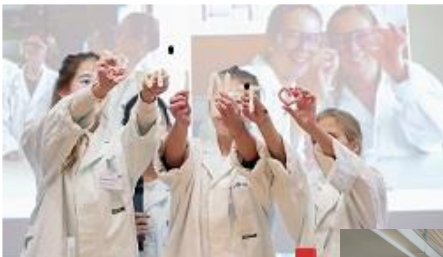
MINT-Preis 2016 mit den Chemie-Girls

Im mathematisch-naturwissenschaftlichen Bereich können unsere Schüler_innen bereits einige Erfolge verzeichnen: