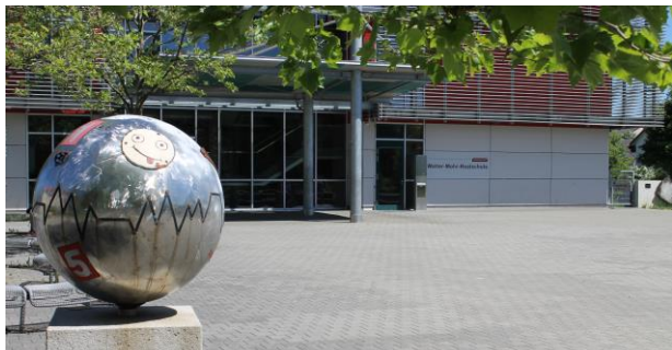
Aktion: Kunst am Bau