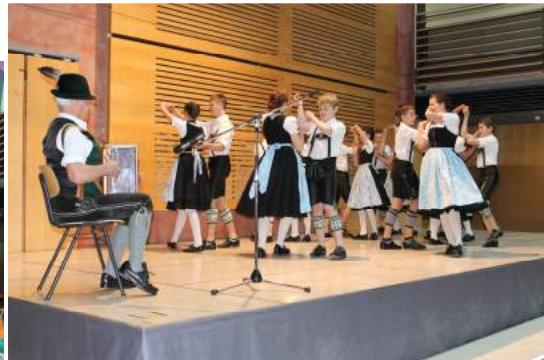
Empfang der chinesischen Gäste an unserer Schule