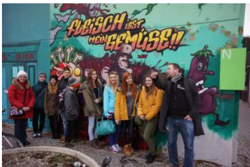
Impressionen aus dem europäischen Graffiti-Projekt

Seit 2008: enge Zusammenarbeit mit Schulen aus vielen Teilen Europas