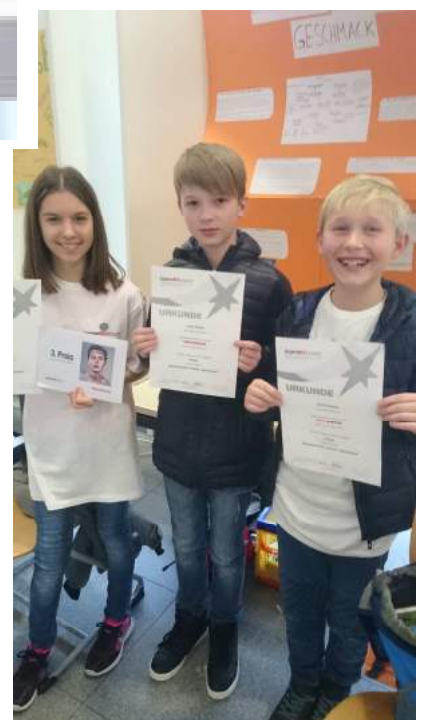
3. Preis 2017 bei „Jugend experimentiert“