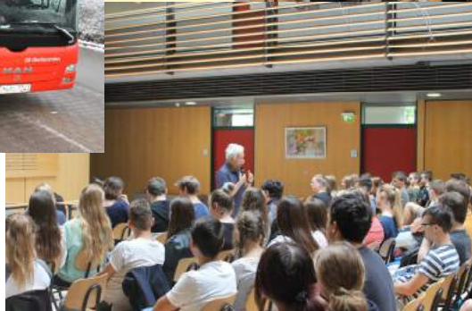
Einladung externer Referenten