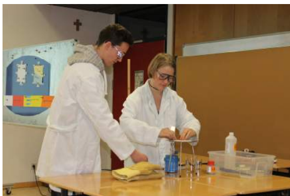
Projektpräsentation der 9. Klassen