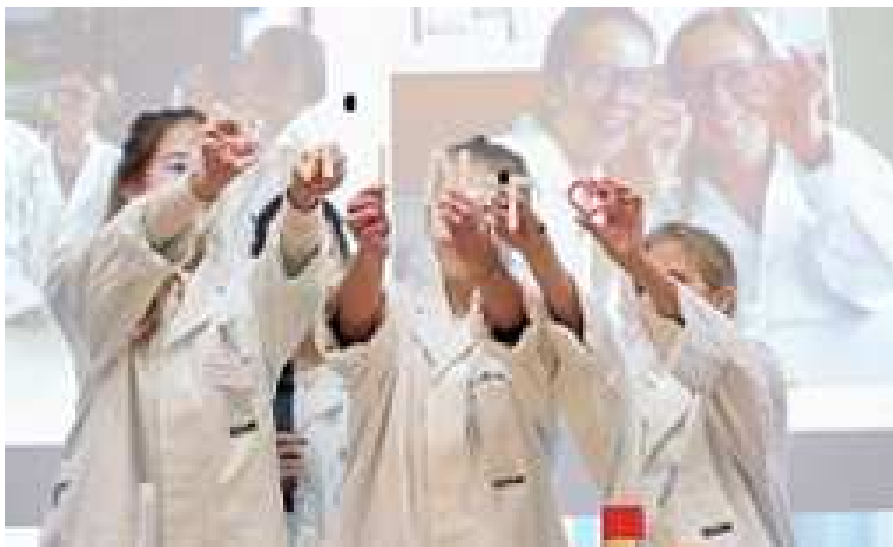
MINT-Preis 2016 mit den Chemie-Girls

Im mathematisch-naturwissenschaftlichen Bereich können unsere Schüler_innen bereits einige Erfolge verzeichnen: